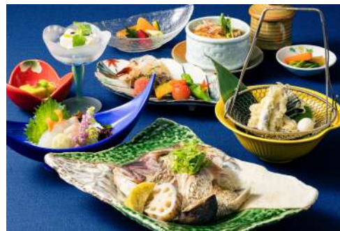
ご夕食は「呉あじめぐり会席」をご用意