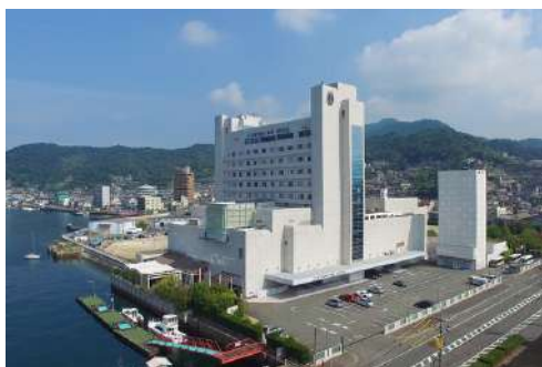
ご宿泊はクレイトンベイホテル